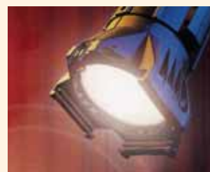
Scène et studio