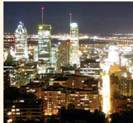
Gestion de propriétés